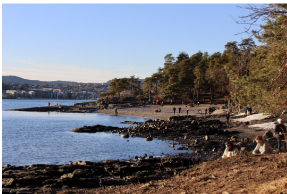
Paradisbukta in Oslo