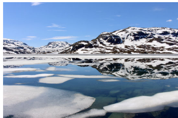
Sommer in Norwegen ☺