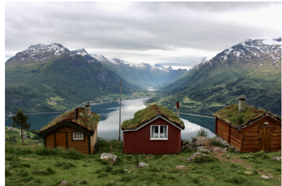
Loen in Norwegen