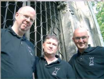
BROEKHUIS, KELLER & SCHÖNWÄLDER [TRANCE & AMBIENT]