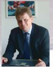
MARTIN SCHWAB [ROCK & BALLADEN]